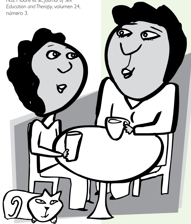
Ilustración por Dominic Cappello ©2000

La familia habla es un boletín informativo que contiene información para ayudar a que todos/as los/as padres, madres y tutores/as hablen con sus hijos/as acerca de la sexualidad y asuntos relacionados.