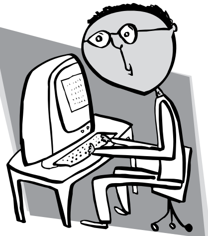
Ilustración por Dominic Cappello © 2000

información y apoyo de compañeros/as para jóvenes homosexuales, bisexuales y transexuales http://www.youthresource.org